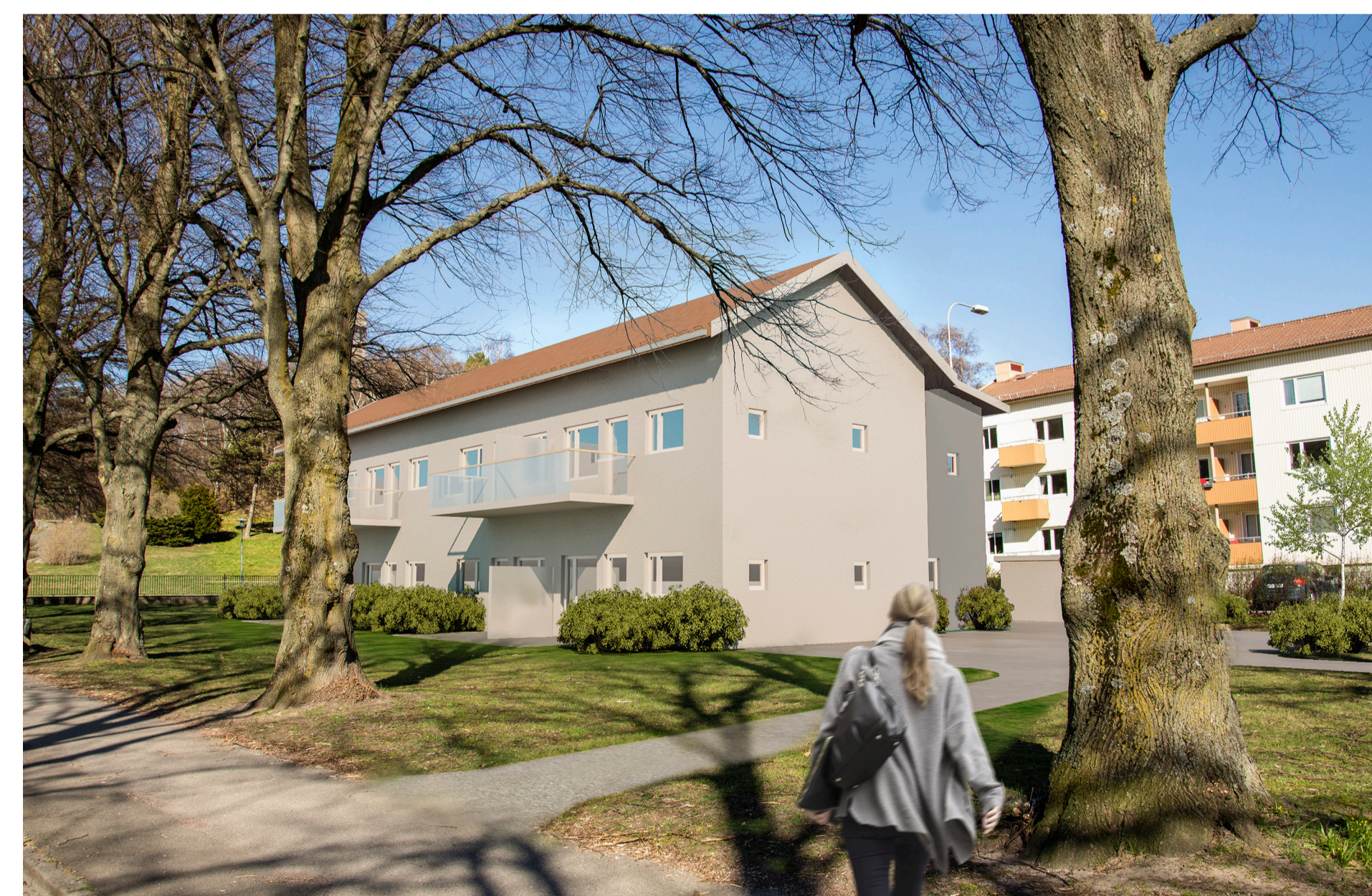
Fotomontage av bebyggelseförslag, Norconsult

Detta är det slutliga planförslaget. Du som vill lämna synpunkter på detaljplanen skall göra detta skriftligen senast i detta skede, annars kan du förlora rätten att överklaga beslut att anta detaljplanen.